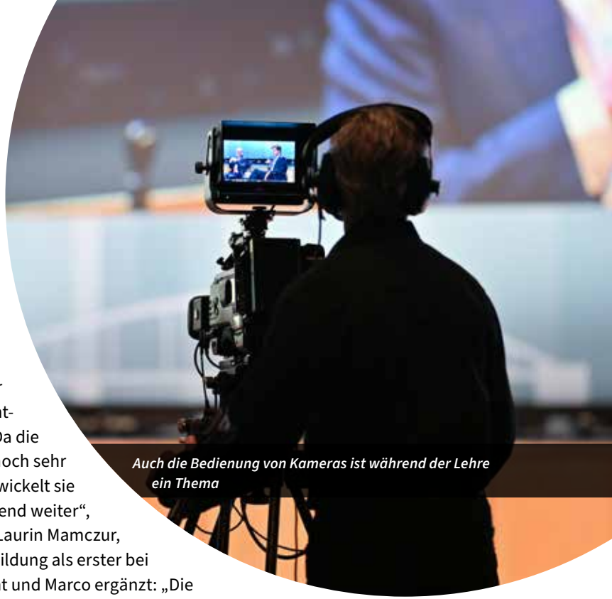
Auch die Bedienung von Kameras ist während der Lehre ein Thema