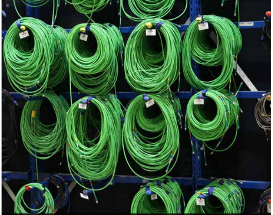
Der Dienstleister bedient alle Gewerke, hat seinen Fokus aber auf der Videotechnik

Im Bereich der Veranstaltungstechnik versucht das Team dabei immer, zwei Auszubildende pro Lehrjahr zu erhalten. Wenn es die Bewerberzahl und -qualität zulassen, dann können es aber auch gerne drei Auszubildende sein. Doch leider nehmen beide Kennzahlen