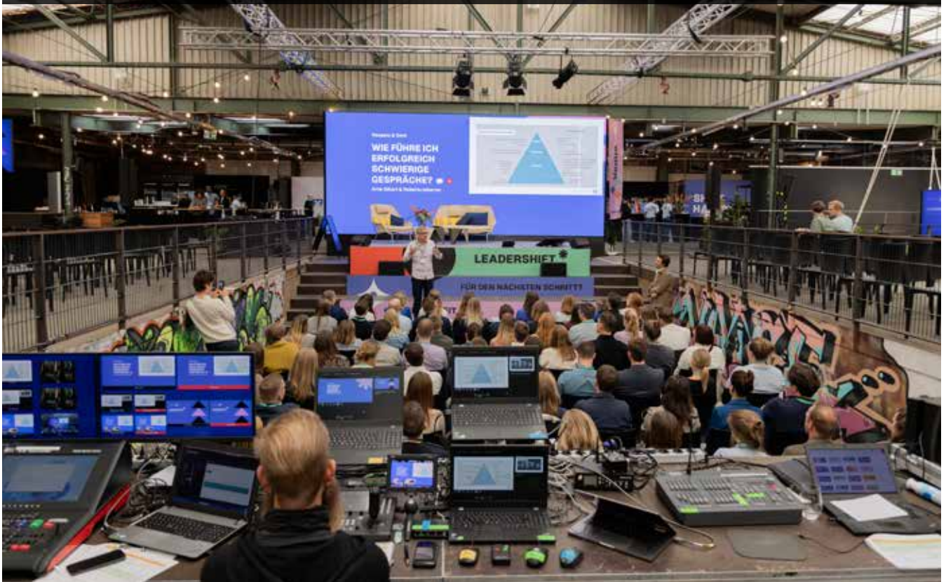
Jede Veranstaltung, egal ob groß oder klein, wird mit dem gleichen Engagement und der gleichen Qualität umgesetzt