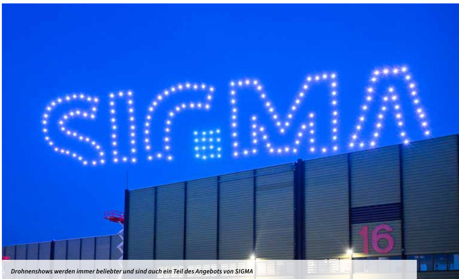
Drohenshows werden immer beliebter und sind auch ein Teil des Angebots von SIGMA

die Fachkraft für Veranstaltungstechnik, aber auch die Lehre zum Kaufmann für Bürokommunikation. Mit zwei Lehrlingen aus diesen Bereichen konnten wir uns beim Besuch vor Ort auch noch unterhalten. ▶