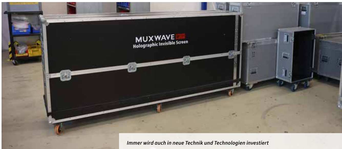
Immer wird auch in neue Technik und Technologien investiert

dahingehend eine Spezialisierung an. Auch beim Thema Netzwerktechnik gehen wir einige Schritte weiter, als sie eigentlich gefordert werden. Aus der Veranstaltungstechnik ist die Netzwerktechnik nicht mehr wegzudenken und daher geben wir dort regelmäßig Schulungen im Unternehmen. Wir bieten diese Inhalte also on top zur eigentlichen Ausbildung.“