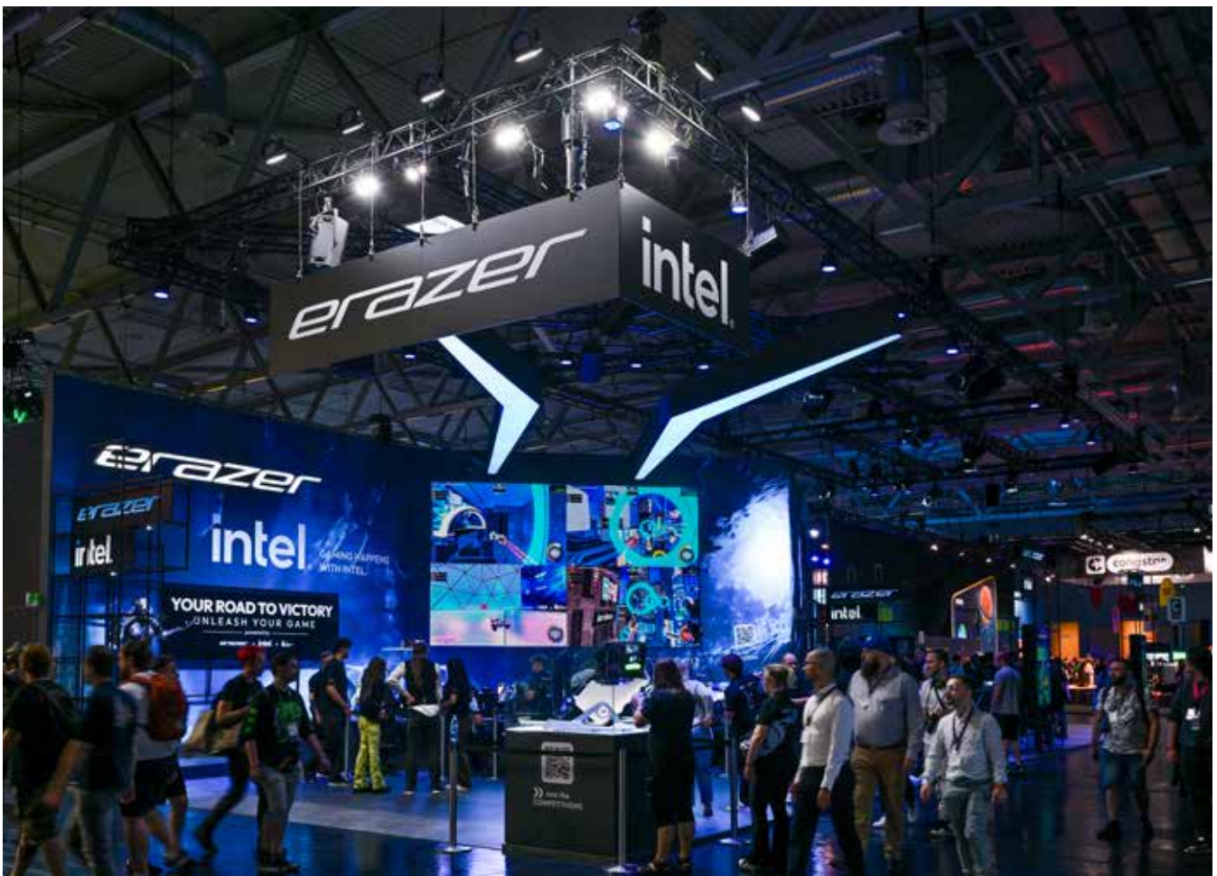
Das Hauptstandbein von SIGMA ist die technische Umsetzung und der Aufbau von Messeständen

überproportional gut entwickelt. „Durch hatten wir auch während der Corona-Jahre kaum Stillstand. Normalerweise haben wir für den Veranstaltungs- und den Installationsbereich eigene Teams. In dieser Zeit konnten wir aber unsere Veranstaltungstechniker oder auch die Auszubildenden in