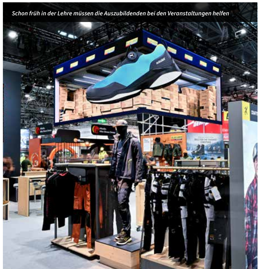
Schon früh in der Lehre müssen die Auszubildenden bei den Veranstaltungen helfen