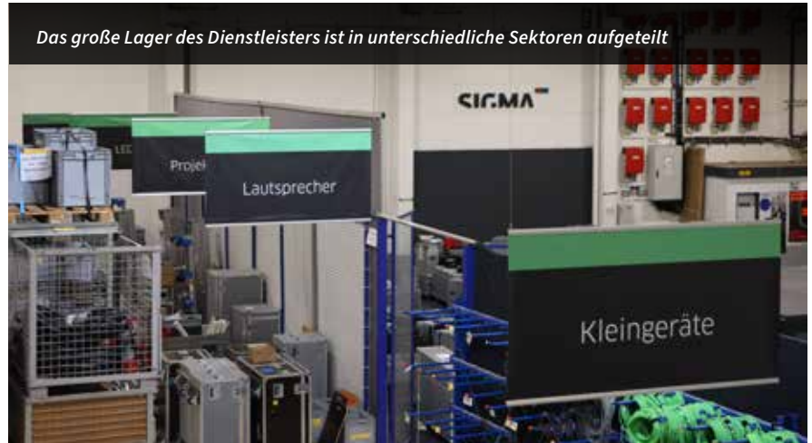
Das große Lager des Dienstleisters ist in unterschiedliche Sektoren aufgeteilt