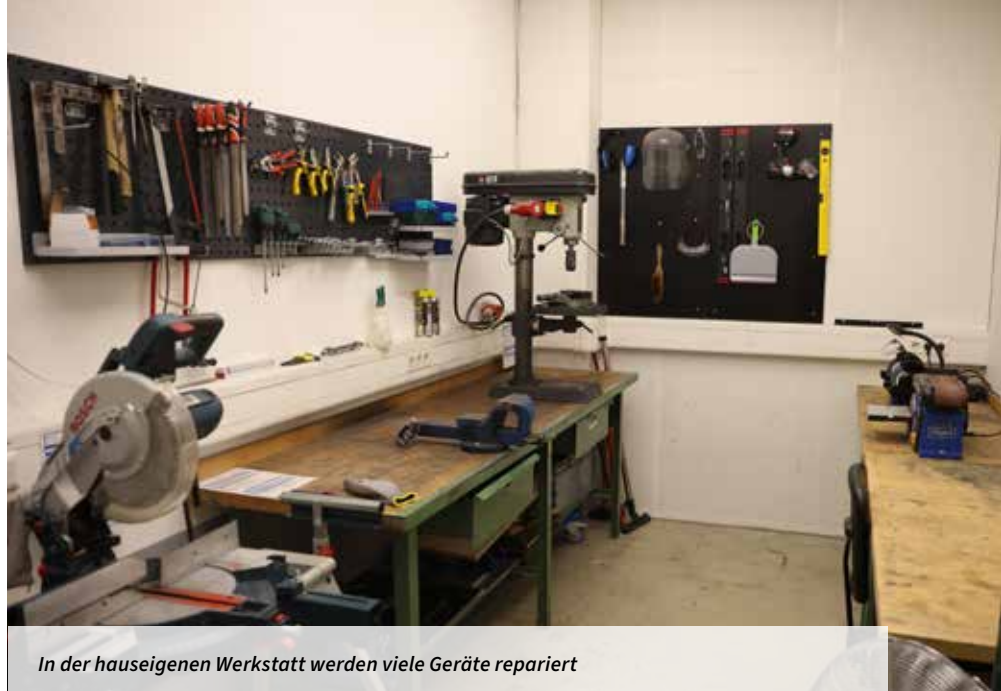
In der hauseigenen Werkstatt werden viele Geräte repariert